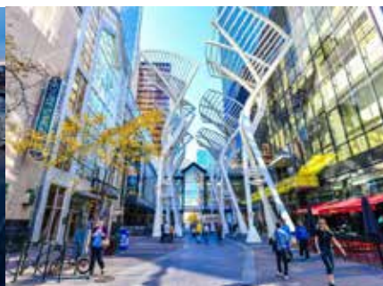
ガレリアツリー ステファンアベニューのシンボリックなアート作品です。記念撮影を忘れずに。