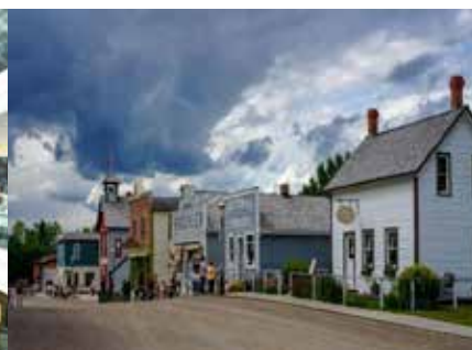
ヘリテージパーク 1914年以前の、実際に使用されていた建物が並び、西部開拓時代の面影を見ることができます。