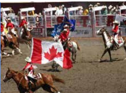
カルガリー・スタンピード 毎年7月上旬に10日間かけて行われるロデオの祭典です。100年以上の歴史を持ちます。