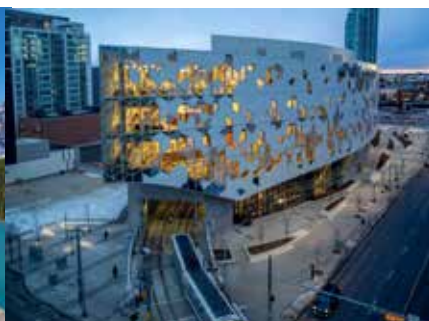
カルガリー中央図書館 SNS上では時折、美しすぎる図書館としても話題になるほど。夜になると幾何学模様の窓から光が漏れ出し、幻想的な雰囲気を演出します。