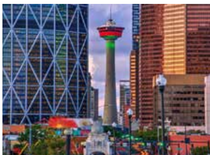
カルガリータワー カルガリーのシンボル 高さ190.8mの塔。 建設は1967年