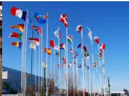
カナダオリンピック公園 1988年の冬季オリンピックのメイン会場となった場所です。ここではリュージュやボブスレー、スキージャンプ競技が行われました。