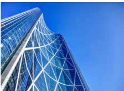
ザ・ボウ 2012年に完成した、58階建てのオフィスビル。高さは237.5mを誇り、カルガリーでは2番目に高い建築物として知られています。