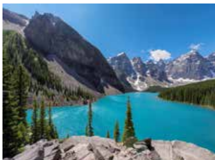
バンフ 広大なカナディアンロッキーの中にあり、観光の拠点となる小さな町。頂上からの眺めが美しいサルファーマウンテンや温泉、川沿いのサイクリングや乗馬、カヌーなどアウトドアアクティビティがたくさん楽しめます。