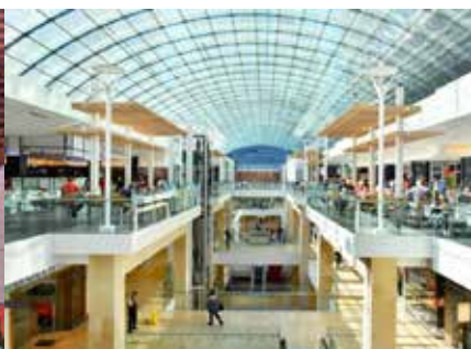
コア・ショッピングセンター カルガリーのダウンタウン内にある唯一のショッピングセンター。4階建ての建物に160の店舗とレストランが入っています。